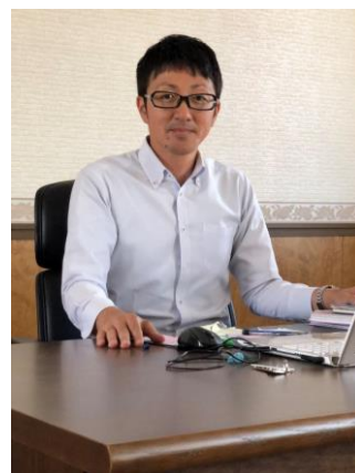
株式会社いばらきのケア